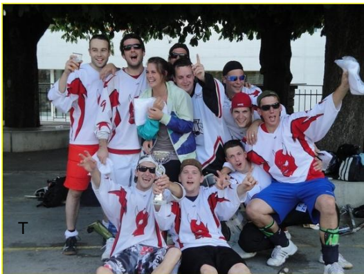
Gewinner Elite: THE LAL