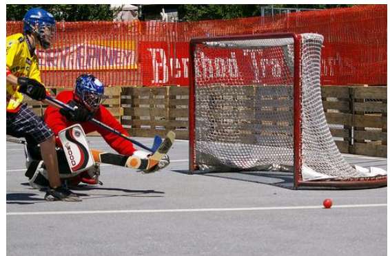
Auch bei den Jüngsten gilt: Knapp daneben ist auch vorbei