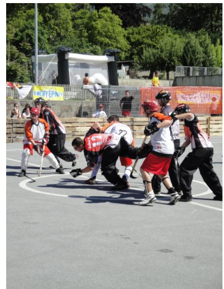
Viel Verkehr beim Bullypunkt